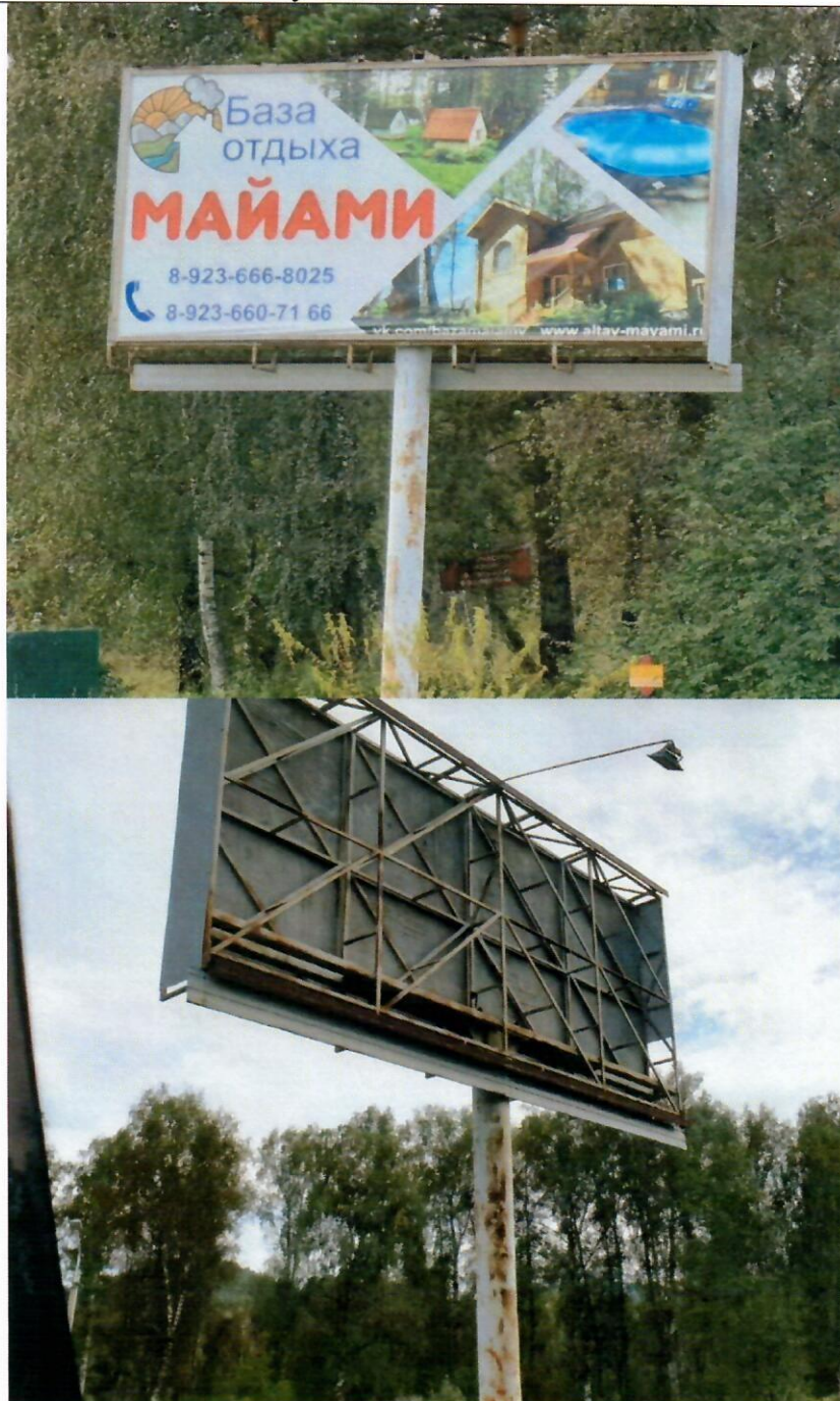
Фото рекламной конструкции

«8» ноября 2024 года отделом архитектуры и градостроительства Администрации муниципального образования «Майминский район» выявлена рекламная конструкция, установленная и (или) эксплуатируемая без разрешения, срок действия которого не истек, установленного по адресу (в случае отсутствия технической возможности определить точное местоположение, указывается ориентировочное расположение): 457км.+985м. трассы М-52 «Чуйский тракт» (справа) в границах неразграниченного земельного участка.